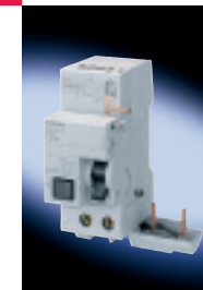
Tableau de sélection et référence de commande Commande et télécommande