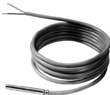
QAZ21... a QAZ36...