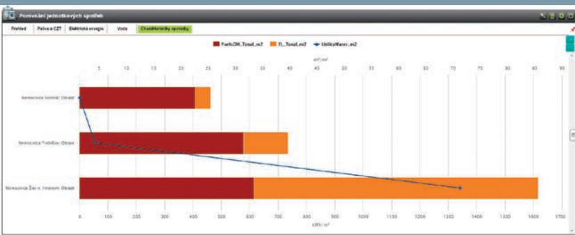
Porovnanie spotrieb objektov zo skupiny medzi sebou s väzbou na m^2 a m^3 – Benchmarking